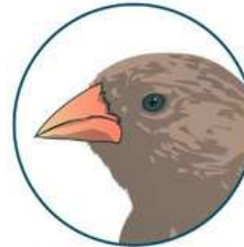
Géospize à bec moyen