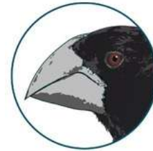
Géospize à gros bec